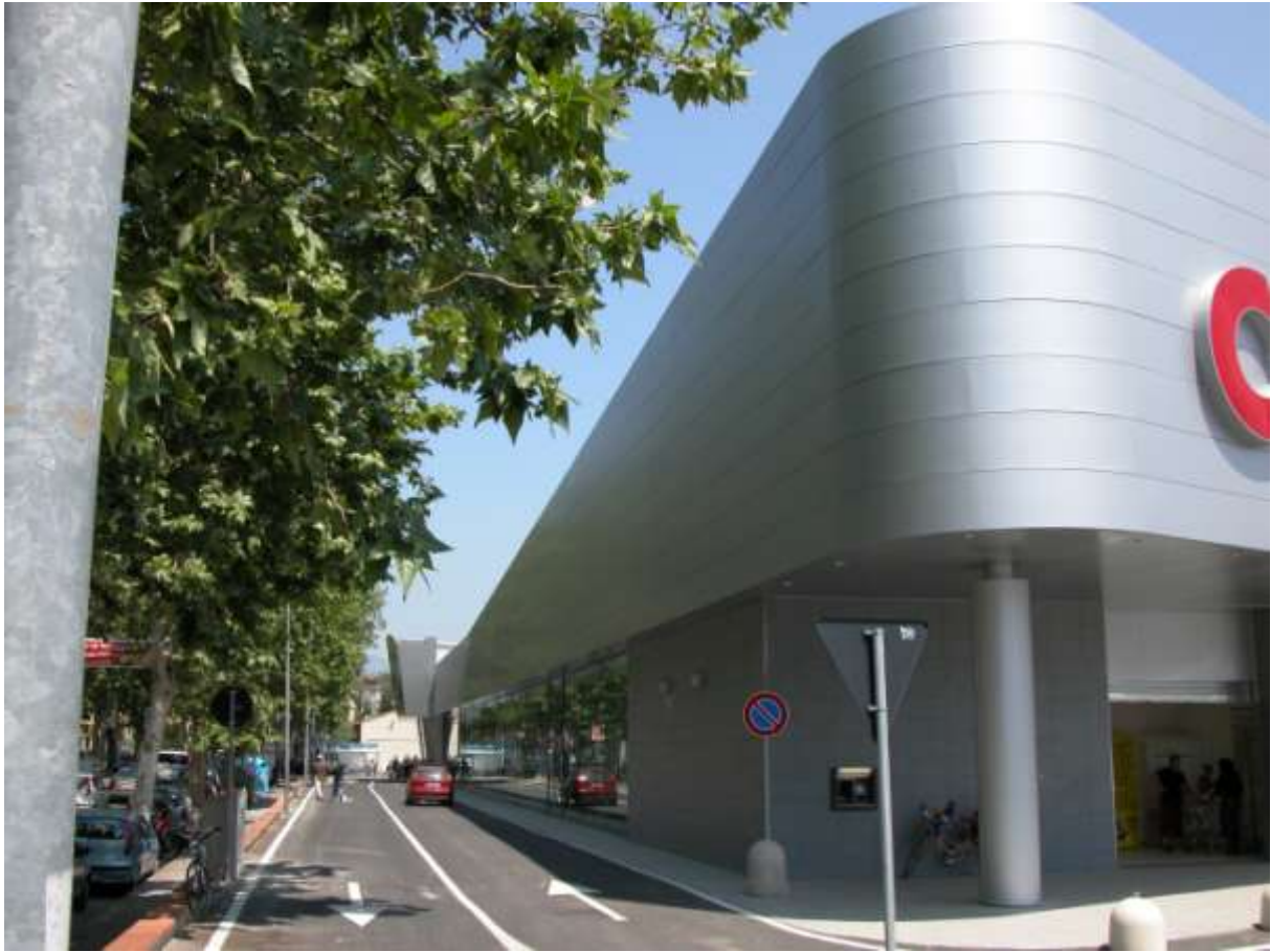
CENTRO COMMERCIALE DI CATENA DI GRANDE DISTRIBUZIONE - PISTOIA