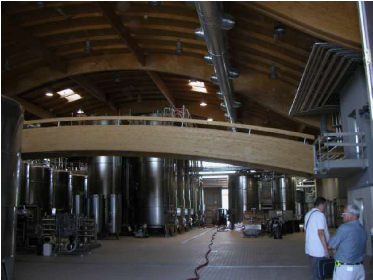
REALIZZAZIONE DI CANTINA DI VINIFICAZIONE A MONTALCINO (SI)