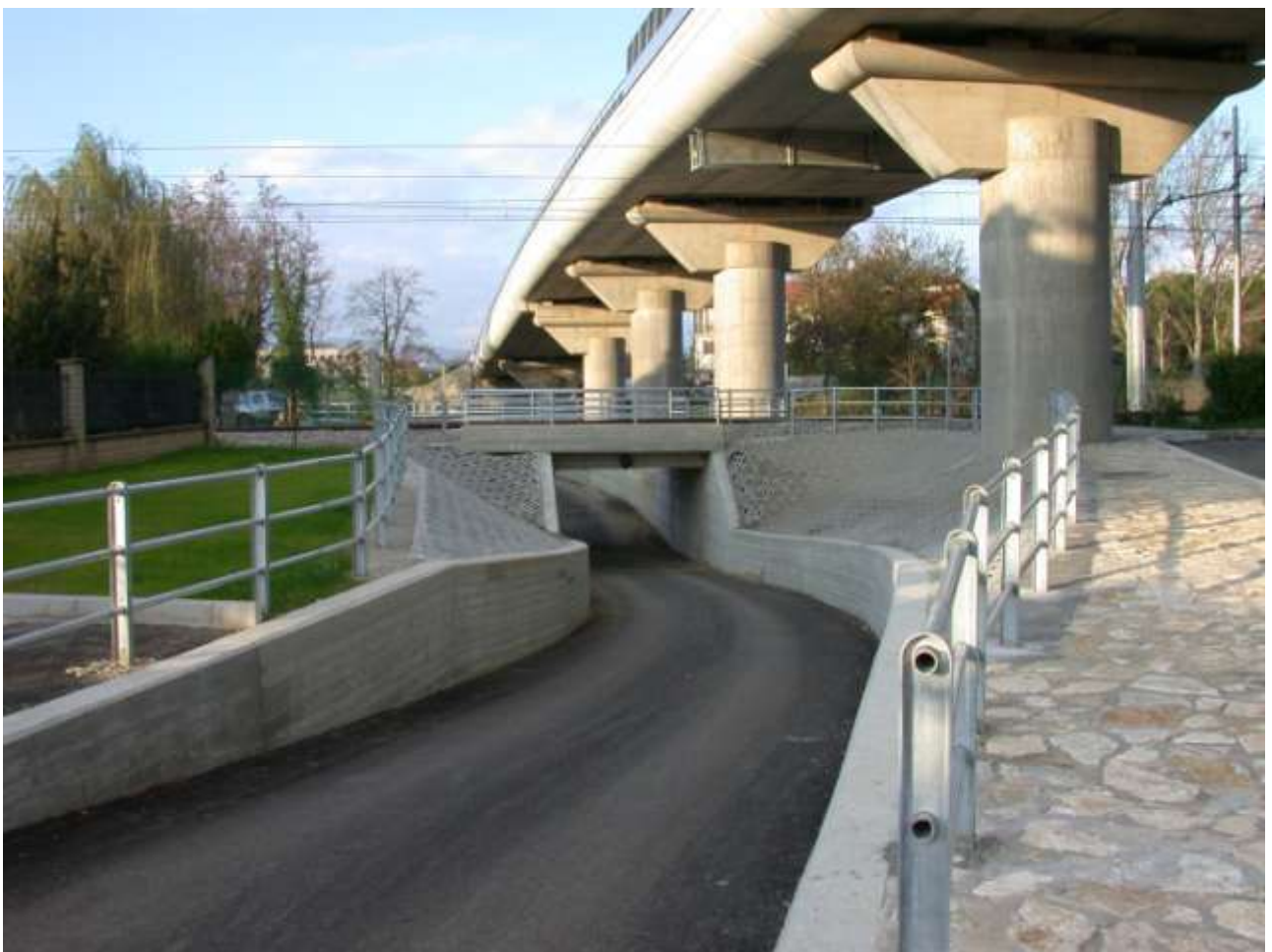
STRADA DI P.R.G. TRA LA MAESTA' DI GIANNINO E VIA ALFIERI - AREZZO