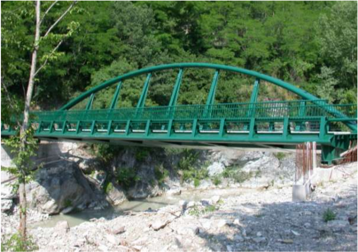
PONTE STRADALE IN LOC. MOLINO DI PIANELLO - PIEVE S. STEFANO (AR)