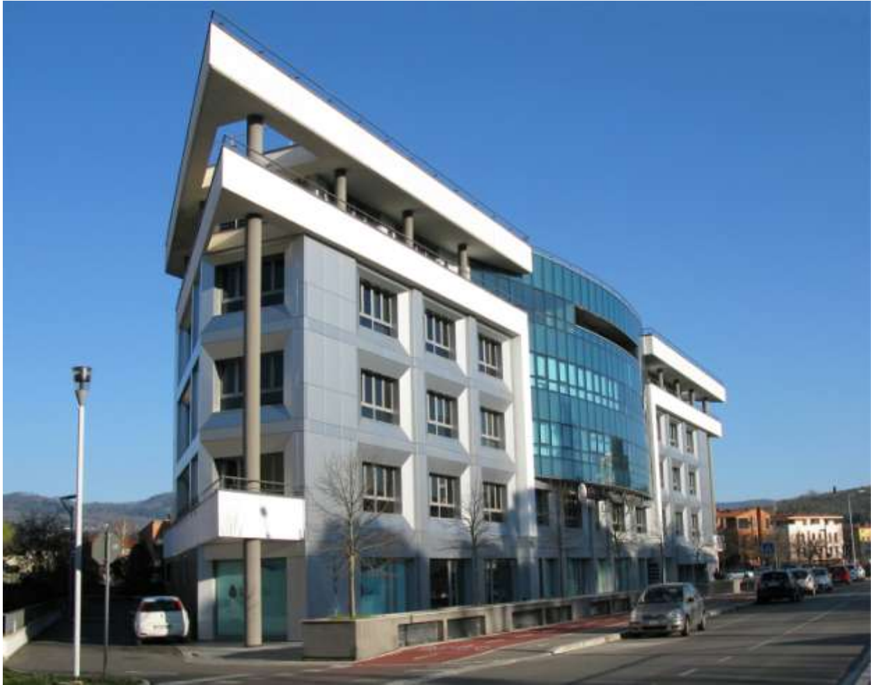
REALIZZAZIONE DI EDIFICIO COMMERCIALE E DIREZIONALE IN AREZZO