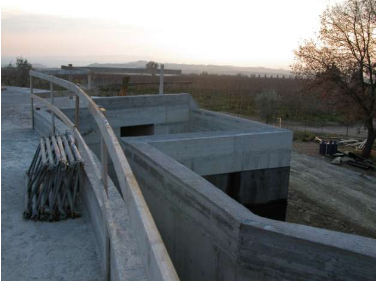
CANTINA DI VINIFICAZIONE A MONTALCINO (SI)