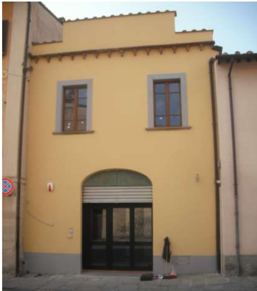
VERIFICA DI SICUREZZA DI CENTRO DIURNO - AREZZO