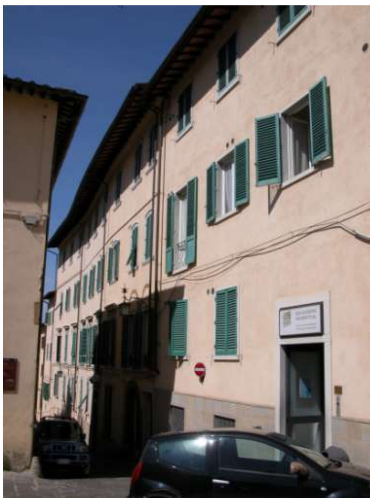
VERIFICA DI SICUREZZA DI CLINICA PRIVATA - AREZZO