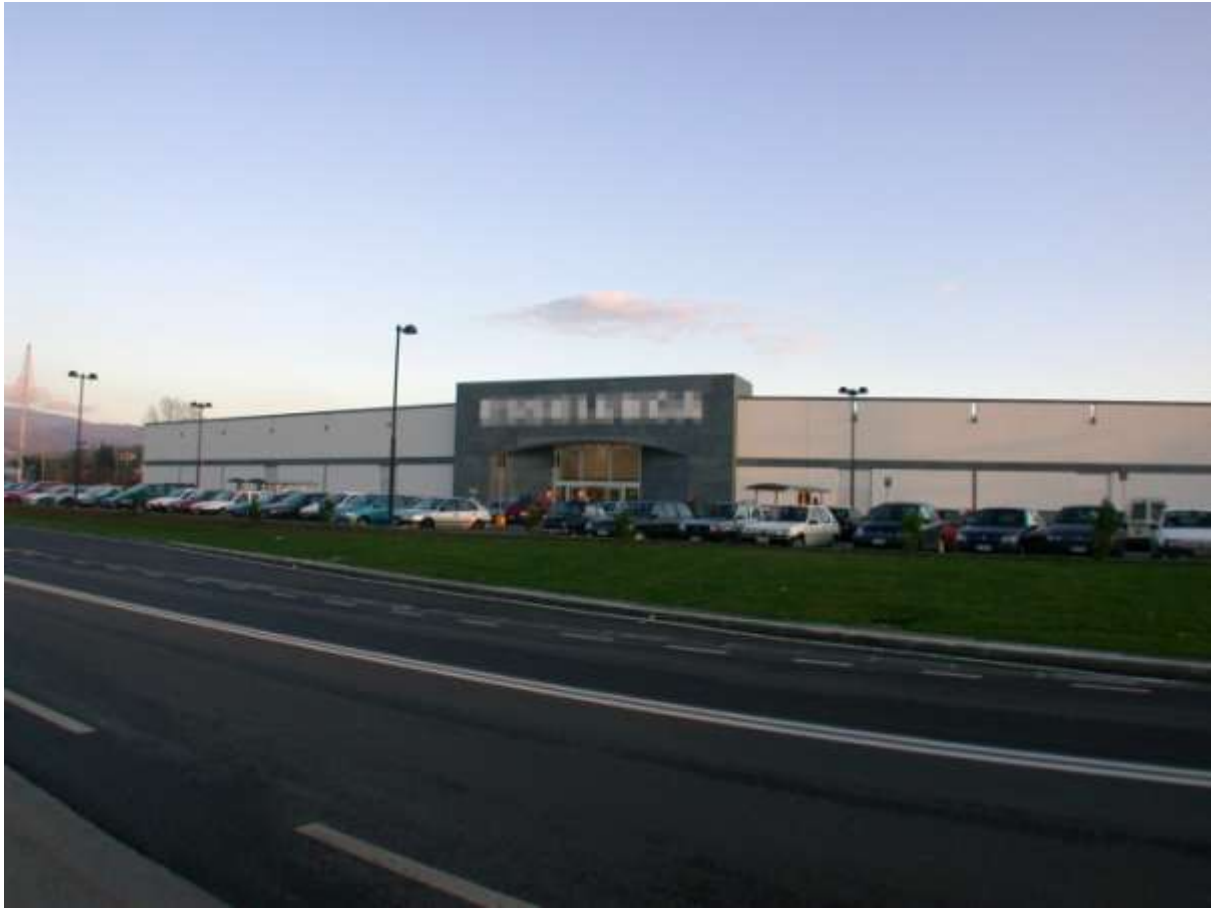
CENTRO COMMERCIALE DI CATENA DI GRANDE DISTRIBUZIONE - AREZZO