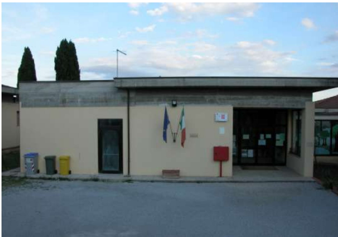
VERIFICA DI SICUREZZA DI SCUOLA PER L'INFANZIA - MONTE SAN SAVINO (AR)