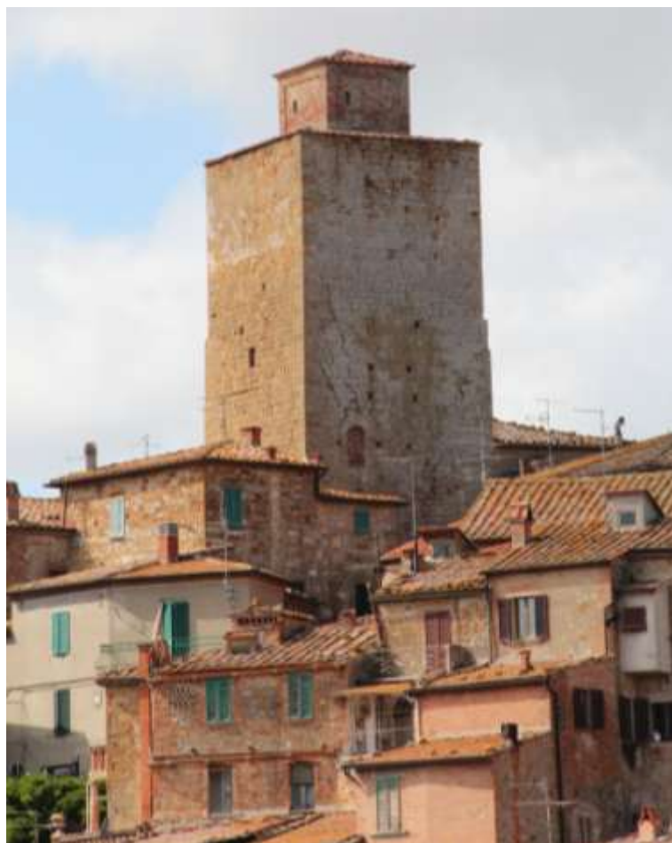
MANUTENZIONE STRAORDINARIA DELLA TORRE CIVICA DI PETROIO - TREQUANDA (SI)