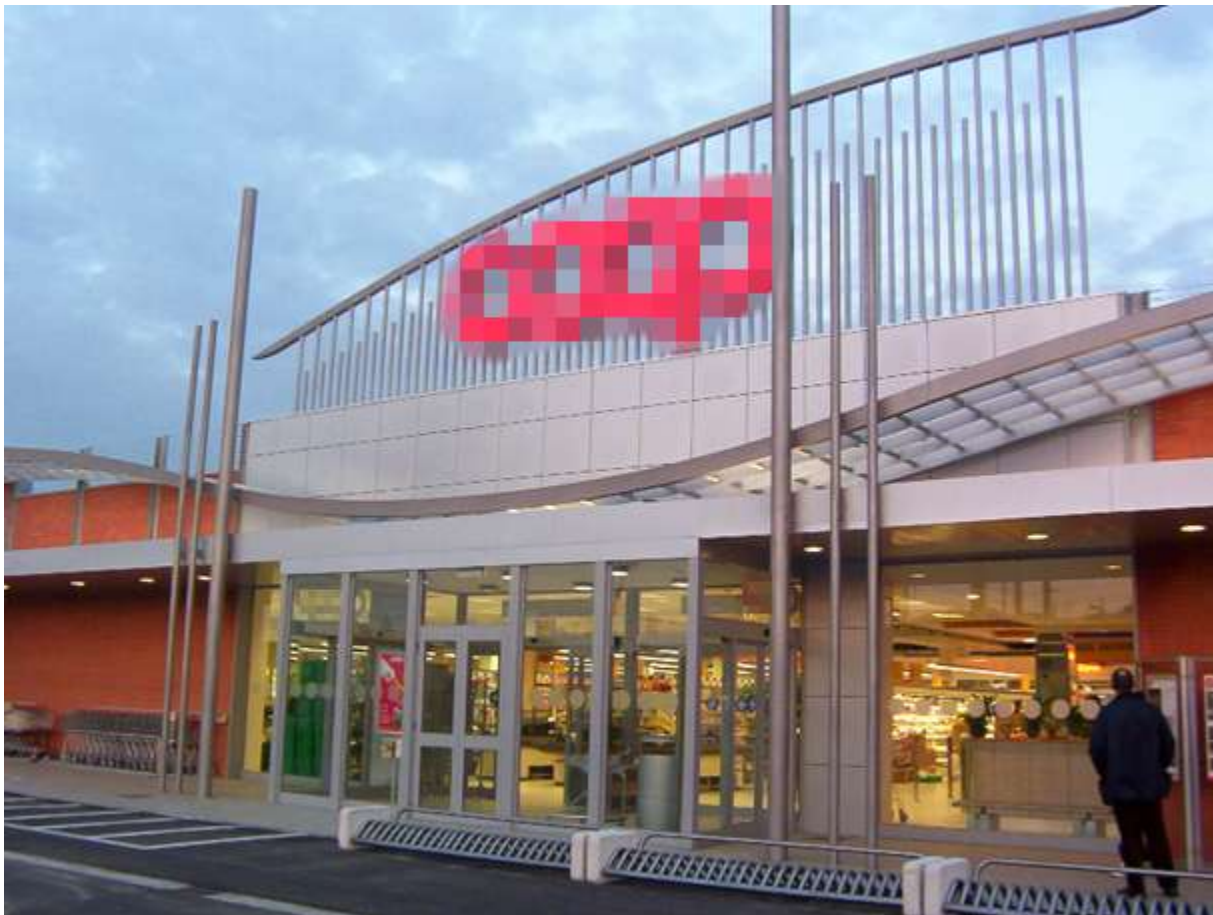
CENTRO COMMERCIALE DI CATENA DI GRANDE DISTRIBUZIONE - BIENTINA (PI)