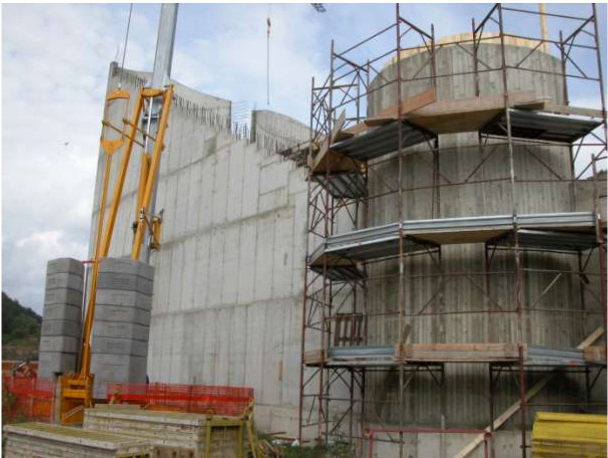
REALIZZAZIONE DELLA NUOVA CHIESA PARROCCHIALE A TERRANUOVA BRACCIOLINI (AR)