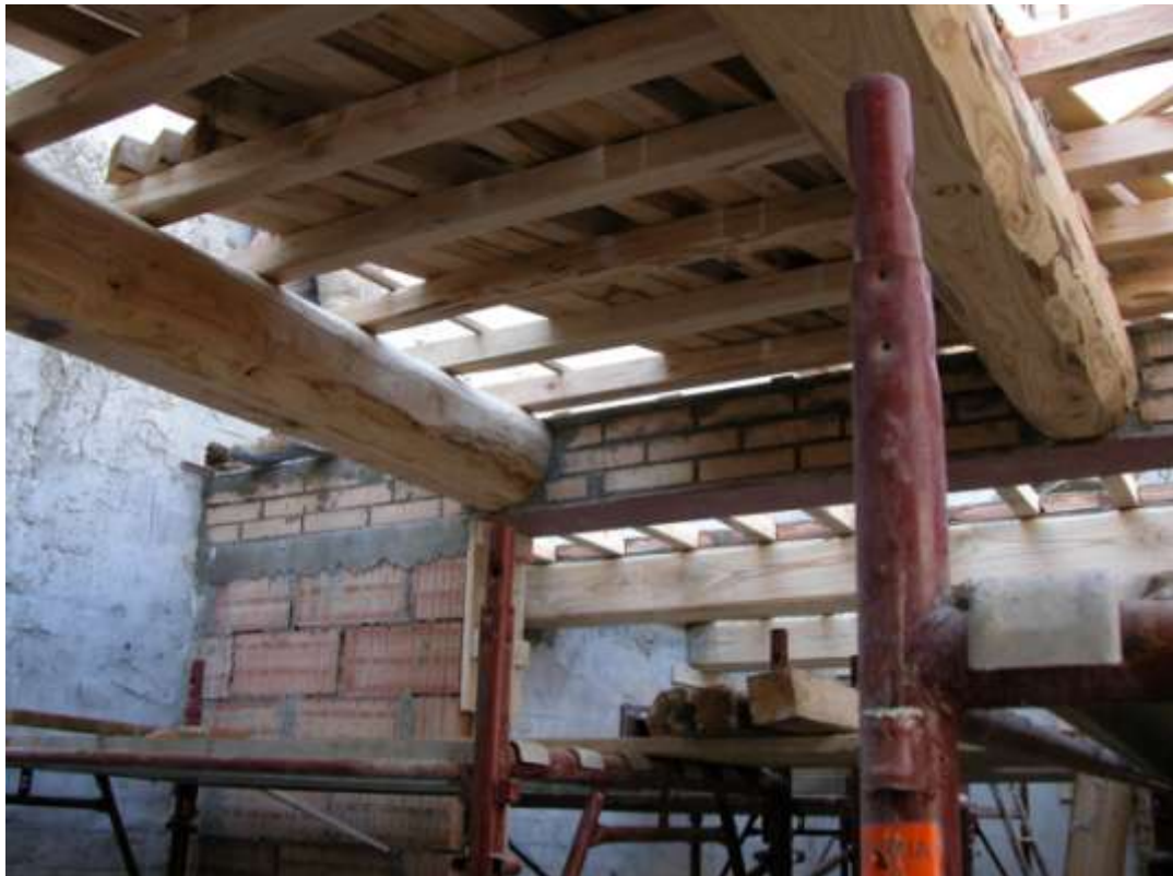
CONSOLIDAMENTO DI "VILLA BRUNELLI" - SAN QUIRICO D'ORCIA (SI)