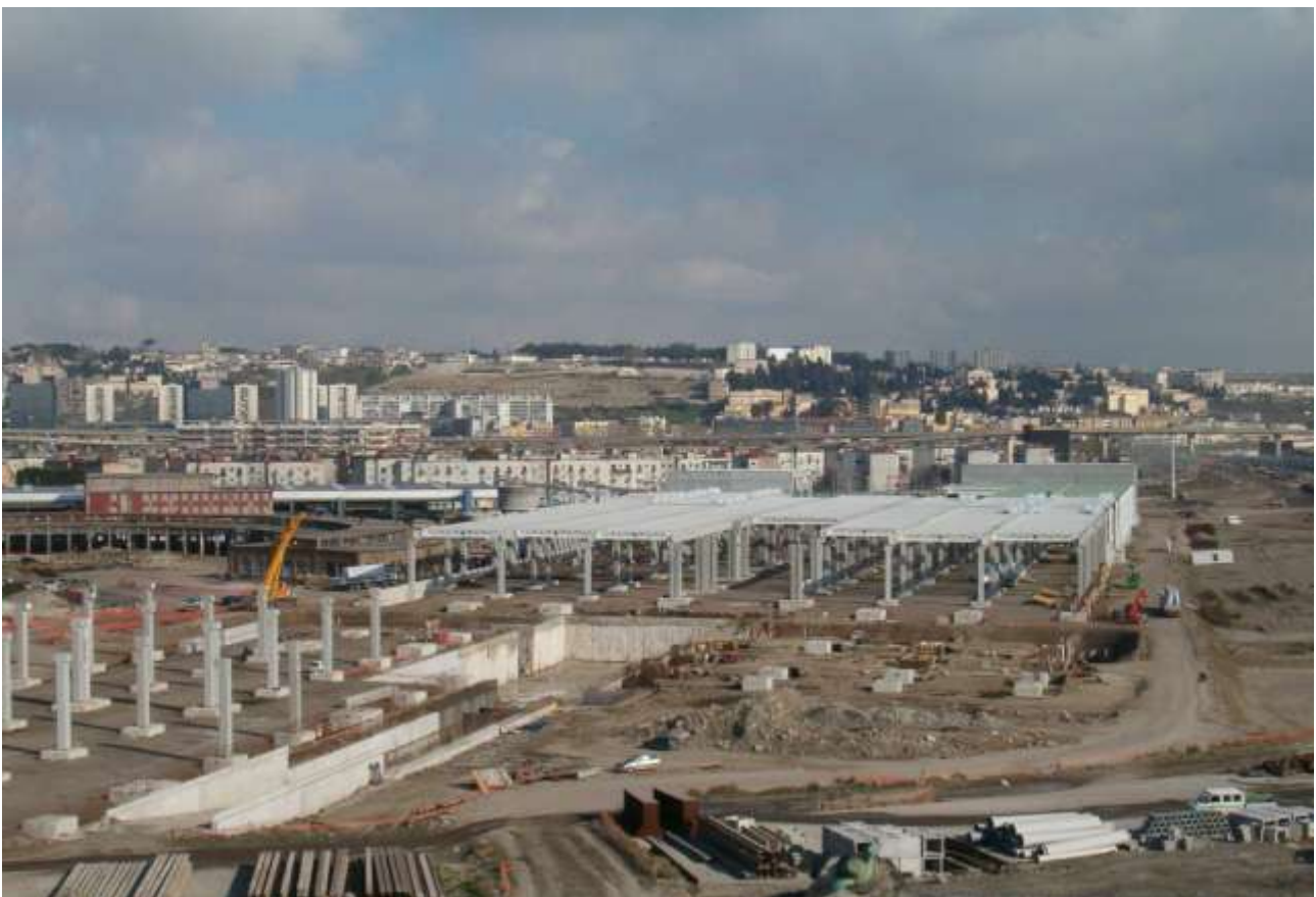
NODO FERROVIARIO DI NAPOLI: IMPIANTO DINAMICO POLIFUNZIONALE