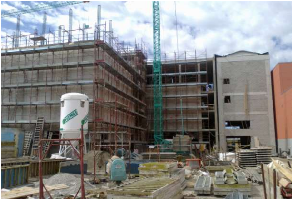
REALIZZAZIONE DI MULINO - CASTELFIORENTINO (FI)