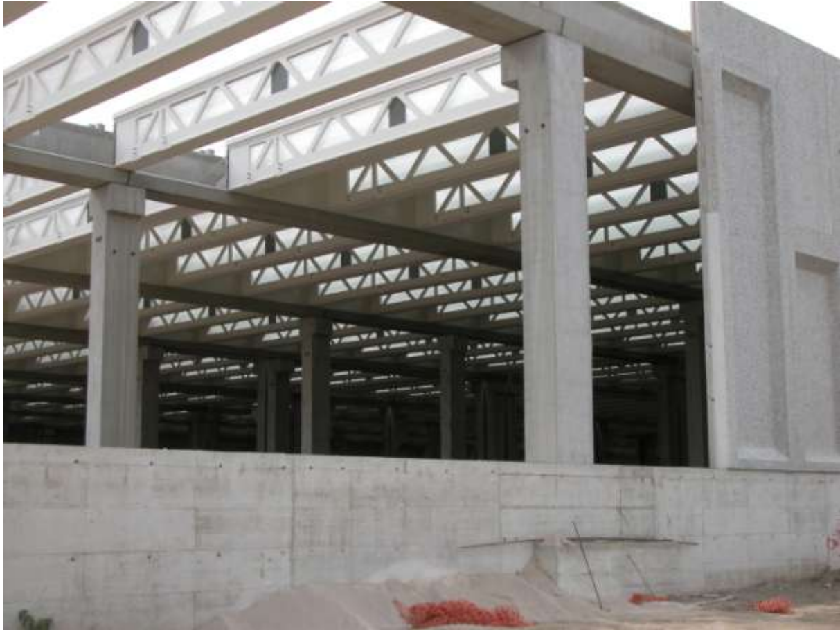
NODO FERROVIARIO DI NAPOLI: IMPIANTO DINAMICO POLIFUNZIONALE