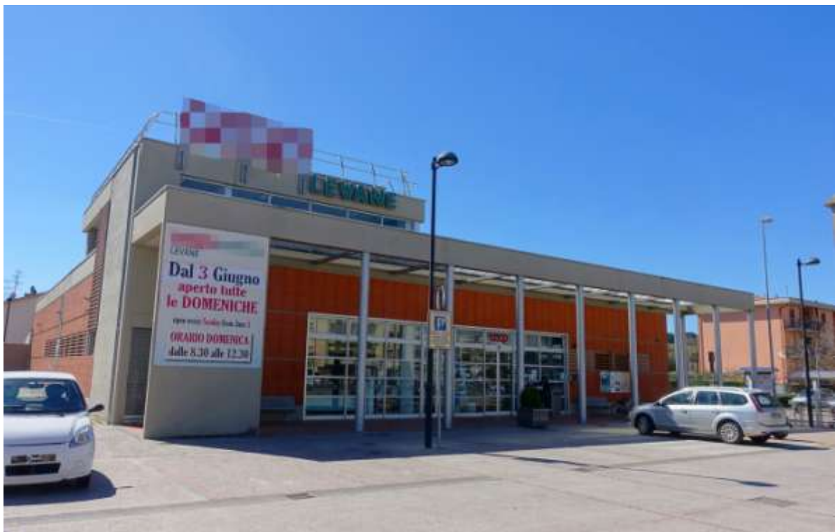
CENTRO COMMERCIALE DI CATENA DI GRANDE DISTRIBUZIONE - LEVANE, MONTEVARCHI (AR)