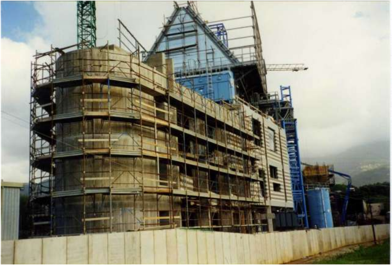
SISTEMA INTEGRATO PER IL TRATTAMENTO, IL RECUPERO E LO SMALTIMENTO DEI R.S.U. DELLA VERSILIA - FALASCAIA (LU)