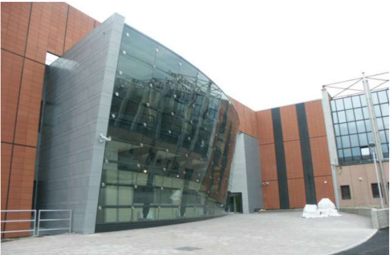
NODO FERROVIARIO DI BOLOGNA: SALA COMANDO E CONTROLLO