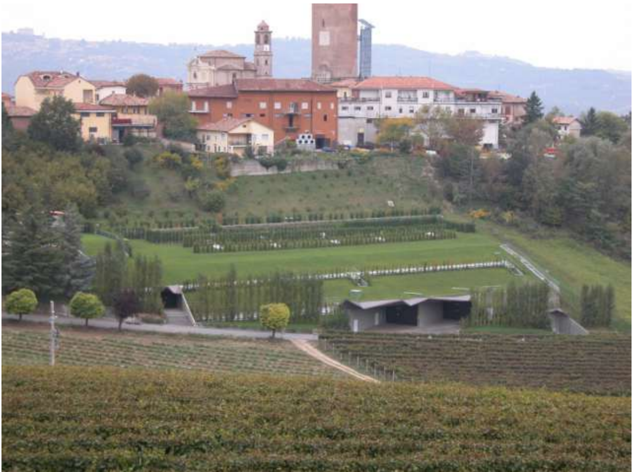
COMPLESSO ENOLOGICO NEL COMUNE DI BARBARESCO (CN)