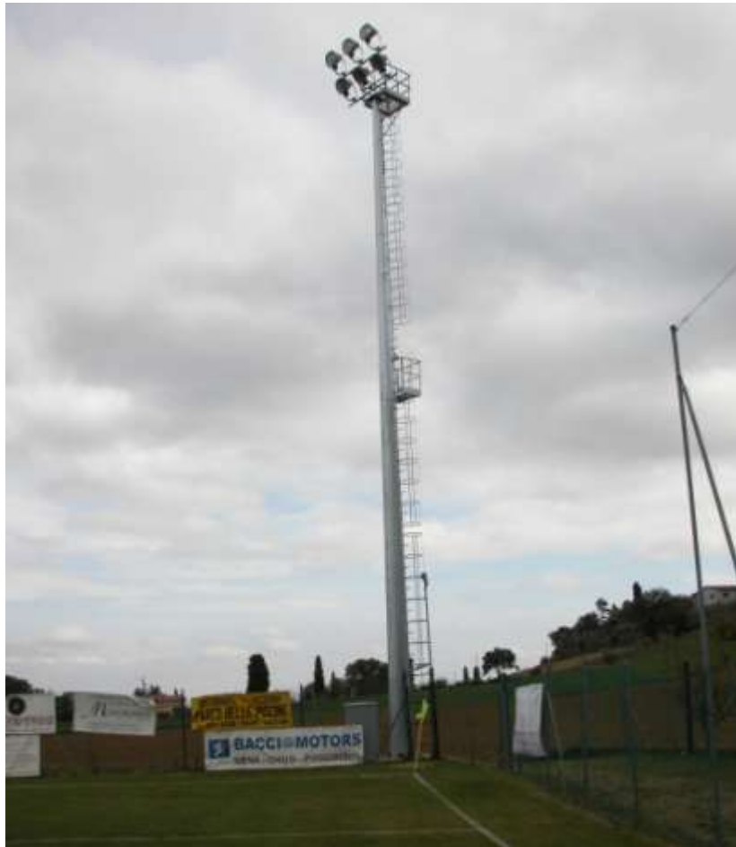
REALIZZAZIONE DI TORRI FARO (COLLAUDO) - SARTEANO (SI)