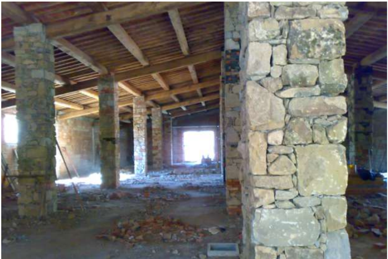
MAGAZZINO PER DEPOSITO BARRIQUES (COLLAUDO) - CASTIGLION FIBOCCHI (AR)