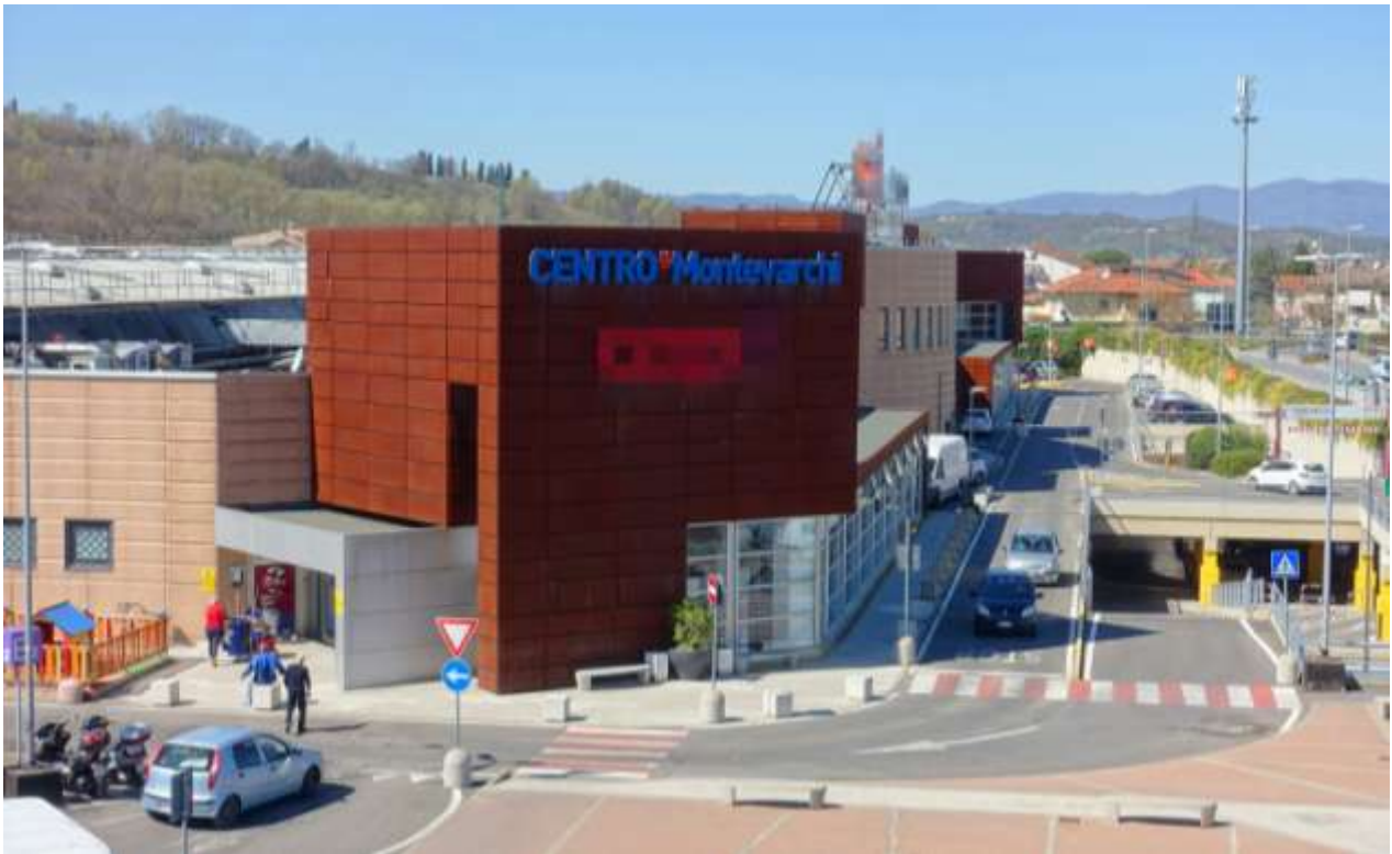
RISTRUTTURAZIONE DI CENTRO COMMERCIALE - MONTEVARCHI (AR)