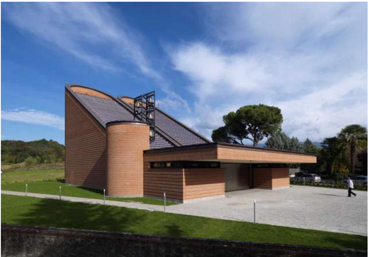
REALIZZAZIONE DELLA NUOVA CHIESA PARROCCHIALE A TERRANUOVA BRACCIOLINI (AR)