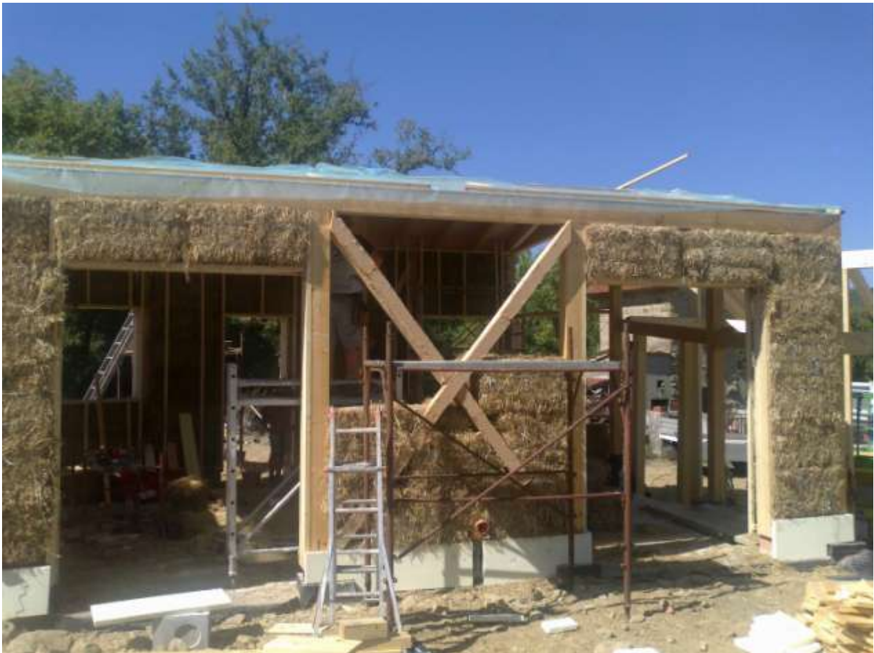
REALIZZAZIONE DI VILLETTA CON TAMPONAMENTO IN PAGLIA - CAPOLONA (AR)